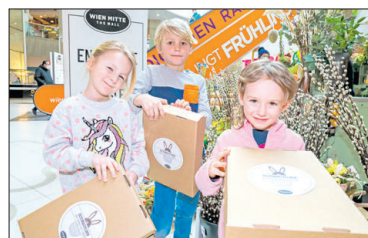
Gratis-Osterboxen gibt es in The Mall.

Digitales Programm Das mumok bietet Online-Atelierworkshops (ab 8 Jahre) und Kunstpicknick (jeden Sonntag um 15 Uhr) an, Teilnahme gratis. Buchbar unter www.mumok.at